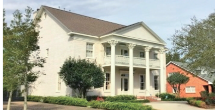
★ルイジアナ州・メテリー

一方、屋根は1920年以前は勾配屋根が一般的だったようです。その後、20世紀中頃になると、屋根は切妻屋根が増えました。これは、少々気難しい伝統的なデザインやクラシカル感の完全な再現を行わなくなったから... 例えば、ヌーボーリッチ(成り金趣味)な雰囲気を持ち一段高くなった玄関のポーチ柱がフェイク(偽)だったり、プシュード(擬)な雰囲気の素材が使われています。しかし、ネオクラシカル様式は、威厳と豪華さを感じるデザインであり現在でも全米で人気のある建築様式として愛されています♡ (最終回)米国取材:大竹清彦