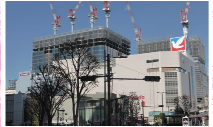
大田区・JR大井町駅前

年末から1月まで東京都内の各地に取材に出かけました。各所の巨大再開発の大きさに驚いていましたが、比較的地味に思っていた大井町では、巨大なツインタワー建築が2026年の完成を目指して進んでいました。