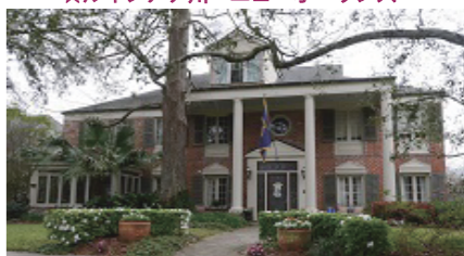
★ノースカロライナ州・チャールストン