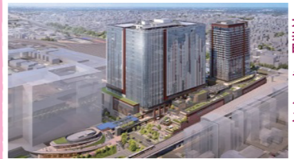
大井町26開業予定の2大井町トラツクス

年末から1月まで東京都内の各地に取材に出かけました。各所の巨大再開発の大きさに驚いていましたが、比較的地味に思っていた大井町では、巨大なツインタワー建築が2026年の完成を目指して進んでいました。