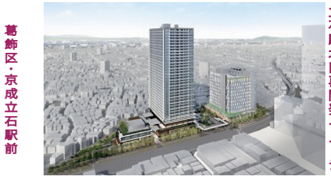
立石駅北口再開発イメージ

葛飾区でも京成立石駅周辺に巨大な街がつけられています。駅の南北3カ所、3棟のタワーマンションを含む再開発計画が発表され「のんべえの聖地消失」と嘆く声をよそに北口ではすでに、建物解体などの工事が進められ