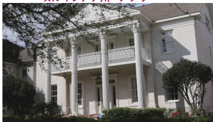
★ルイジアナ州・ニューオーリンズ